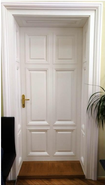
Прилог бр. 1. – слике врата обострано